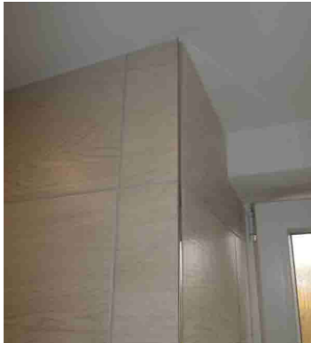
KERAM.OBKŁAD S UKONČUJÍCÍ LIŠTOU